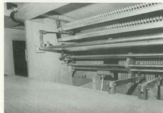
Traktur im Koppelbereich