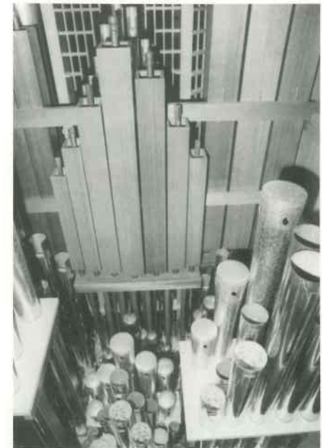
Pfeifen Hauptwerk und Pedal